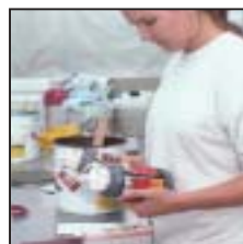
Facetten einer modernen Maler-Ausbildung.